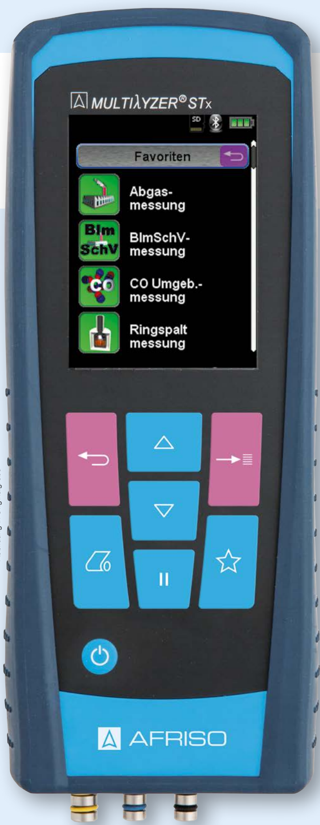
Abbildung in Originalgröße